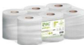
ZELEKO SECAMANOS 180 m Bobina de 2 capas, precortada, en papel reciclado y con ECOLABEL. 514 Servicios. 350 mm x 215 mm Extracción central 6 Bobinas/Paquete Ref. 1200