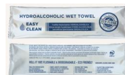
TOALLITA HIDROALCOHOLICA "Roll it" – Enrolladas Sobre: 14,5 x 4 cm 100% Biodegradables 150 Uds/Paquete Ref. 25064