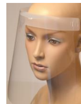
PANTALLA PROTECTORA FACIAL Pack 4 Unidades Ref. TS 88