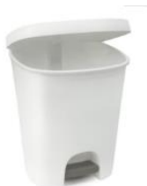
PAPELERA 25L CON TAPA Y PEDAL Papelera Blanca y Pedal Gris 36 x 30 x 42 cm. 25L Ref. 04531