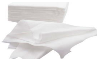
TOALLA AIR LAID BLANCA Toalla desechable fabricada en Air Laid 100% biodegradable y compostable de 55 gr/m 2 , con una extraordinaria capacidad de absorción. 1 Paquete 100 unidades/ 6 Paquetes por caja. Ref. V3180