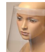
Pantalla Protectora Facial Pack 4 und Ref. TS88