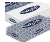
Bulky Soft Pañuelos faciales (40 x 100) Ref. 68100